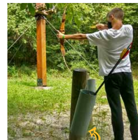
TIRO CON ARCO